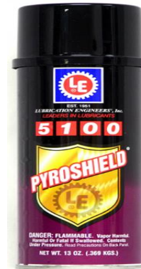
LE 5100 Pyroshield

Applicera LE 5100 Pyroshield i jämnt lager på torr yta och låt dunsta i 2 timmar innan sjösättning.